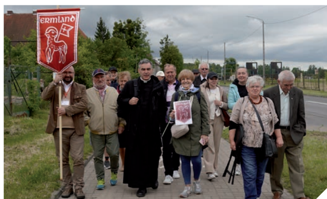
Die Allensteiner Ermländer in Braunsberg auf dem Weg zur Seligsprechung