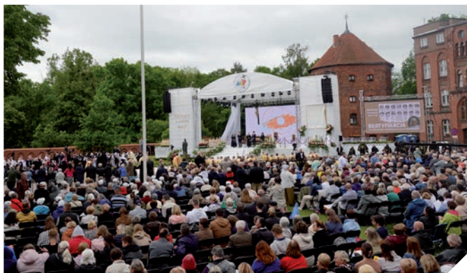
Die Menschen strömen zur Messe vor der Katharinenkirche

Es war die erste Hauptstadt des Bistums Ermland. Hier gründete unter anderem die selige Regina Protmann die Kongregation der Heiligen Katharina. Heute liegt Braunsberg am Rande der EU, nahe der Grenze zu Russland. Doch am 31. Mai stand es im Mittelpunkt des Interesses nicht nur Ermlands und Polens, sondern weltweit. Gleich 15 Personen auf einmal, 15 Katharinenschwestern, wurden in einer feierlichen Zeremonie seliggesprochen.