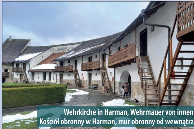
Wehrkirche in Harman, Wehrmauer von innen Kościół obronny w Harman, mur obronny od wewnątrz