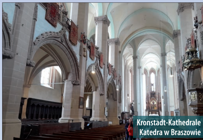
Kronstadt-Kathedrale Katedra w Braszowie