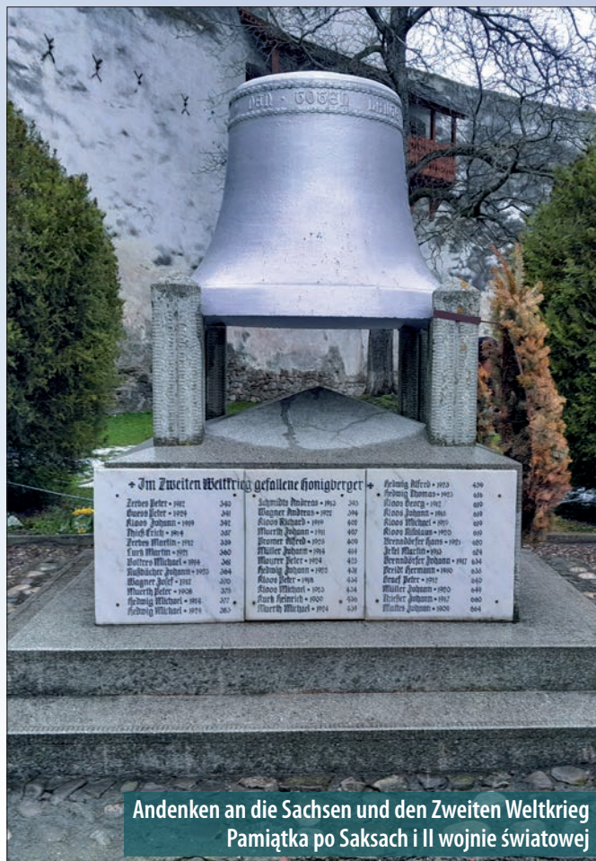
Andenken an die Sachsen und den Zweiten Weltkrieg Pamiętka po Saksach i II wojnie światowej