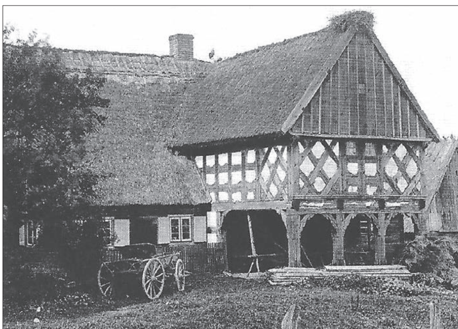
Szachelcowa chata podcieniowa w Chojniku pow. morąski, 1893 r.