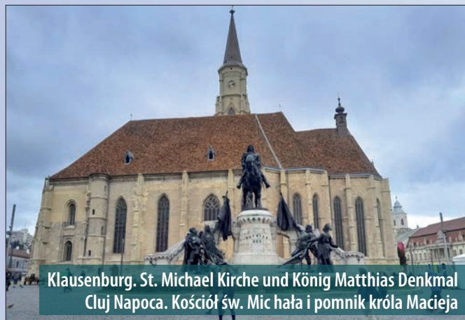
Klausenburg. St. Michael Kirche und König Matthias Denkmal Cluj Napoca. Kościół św. Michała i pomnik króla Macieja