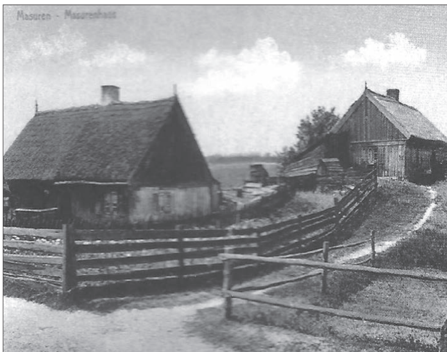
Chłopskie chaty na Mazurach Bauernhäuser in Masuren