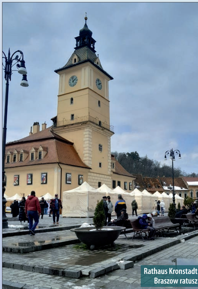
Rathaus Kronstadt Braszow ratusz