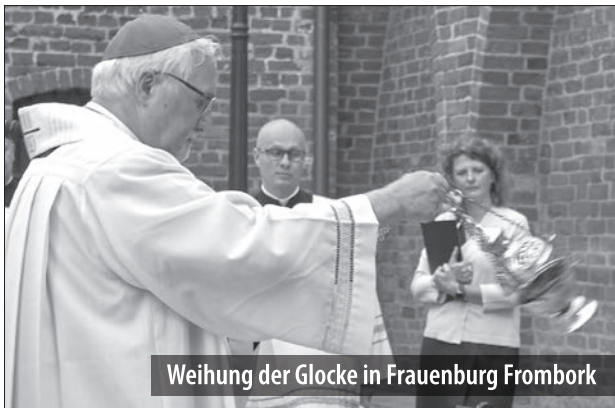
Weihung der Glocke in Frauenburg Frombork

Am 24. und 25. Juni ging mit der Übergabe dreier Kirchenglocken in Siegfriedswalde (Żegoty), Elbing und Frauenburg eine Phase des Projekts „Friedensglocken für Europa“ der katholischen Diözese Rottenburg-Stuttgart zu Ende. Auf Initiative von Bischof Dr. Gebhard Fürst werden so genannte Leihglocken, die in Kirchen seiner Diözese hängen, an ihre früheren Heimatkirchen zurückgegeben. Die Delegation wurde dabei von Baden-Württembergs aus dem Ermland stammenden Ministerpräsidenten Winfried Kretschmann begleitet.