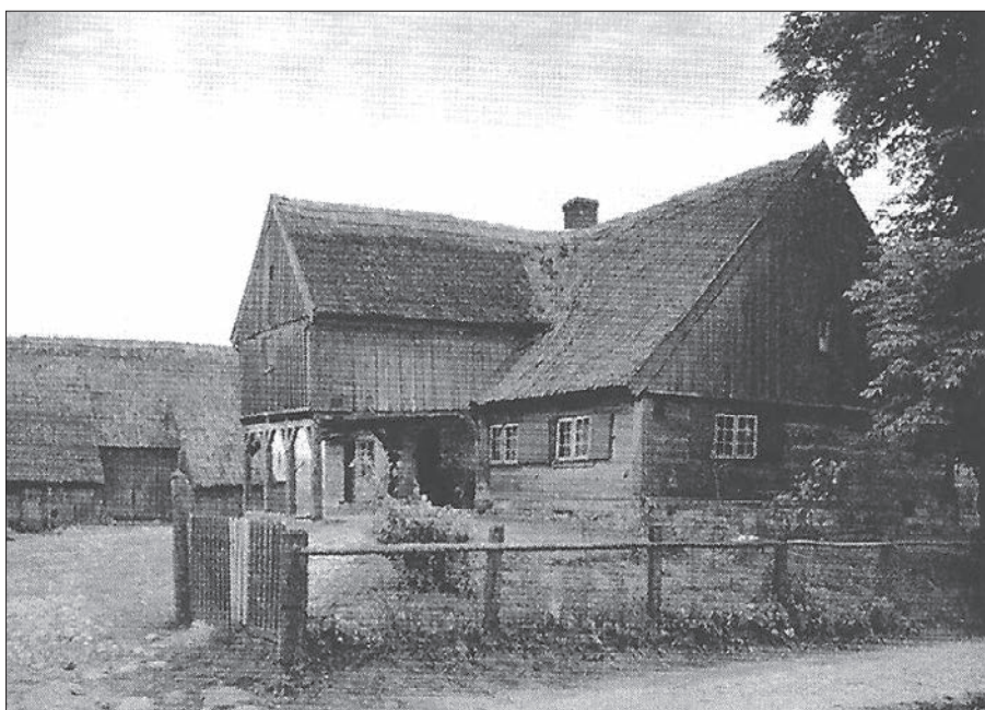
Chata podcieniowa i zagroda w Myślicach (pow. morąski). Zbudowana z belek i desek na fundamencie z kamienia

Das Vorlaubenhhaus kam aus Mitteldeutschland zusammen mit den Ansiedlern und zählte zu den Wahrzeichen des Oberlandes. Es war rechteckig, stand auf einem Fundament auf Feldsteinen, hatte inmitten der langen Frontseite eine von gezeigten Pfosten getragene, weit vortretende Vorlaube und bestand aus Erd-, Ober- und Dachgeschoß. Die Vorlaube über den Eingang zum Haus war als Fachwerk (seltener in Brettern) ausgeführt und gab dem Haus durch das bunte Balkenwerk und den weißen Putz ein freundliches Aussehen. Die Vorlaube war zweistöckig und diente als Kammer, Kornspeicher, sehr selten als Wohnraum. Sie ragte fast in die Straße und erlaubte bei schlechtem Wetter, den Wagen unter dem Vorlaubendach zu be- oder entladen. An warmen Abenden trafen sich unter den Vorlaubendach die Hausbewohner. Es war ein beliebter Treffpunkt im Freien. Heute sind nur einzelne klassische Vorlaubenhäuser vorhanden, zum Beispiel im Oberland in der Elbinger Gegend und im Großen Werder. Die Bauern im Oberland bauten auch sogenannte Loggiahäuser – eine Abwandlung des Vorlaubenhauses, bei denen sie den Eingang von der Außenwand nach innen zogen, und so eine Nische entstand, eine Art der Rücklaube.