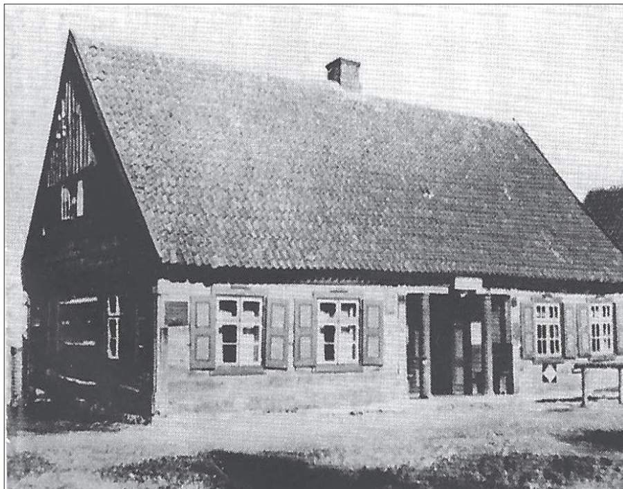
Gospoda w Dobrzykach (pow. morąski) jest przykładem tzw. „domu z loggią” Das Gasthaus in Weinsdorf (Kr. Mohrungen) galt als Beispiel eines „Loggiahauses“

Chata podcieniowa pojawiła się wraz z osadnikami ze środkowych Niemiec i było jednym z symboli Prus Górnych. Była prostokątna, postawiona na kamiennym fundamencie, miała pośrodku długiej frontowej strony daleko wysunięte podcienie stojące na zdobionych słupach i składała się z parteru piętra oraz poddaszy. Podcienie nad wejściem do chaty wykonane było w konstrukcji szkieletowej, rzadziej z desek, i dzięki swej barwnej konstrukcji barkowej oraz białemu tynkowi nadawało przyjazny wygląd domu. Podcienie było dwupoziomowe i służyło jako spiżarnia oraz spichlerz, bardzo rzadko jako pomieszczenie mieszkalne. Było ono wysunięte aż do drogi i umożliwiała z-a i rozładowanie wozów w czasie złej pogody pod jego dachem. W ciepłe wieczory pod tym dachem spotykali się mieszkańcy chaty. Było to ulubione miejsce spotkań na powietrzu. Do dzisiaj przetrwały tylko pojedyncze, klasyczne chaty podcieniowe, na przykład w Prusach Górnych, w okolicach Elbląga i na Żuławach. Chłopi w Prusach górnych stawiali też tzw. „chaty z loggią”. Była to odmiana chaty podcieniowej, w której wejście cofnięte było od ściany frontowej do środka i w ten sposób powstawała niska wnęka podcieniowa – rodzaj schowanej altanki.