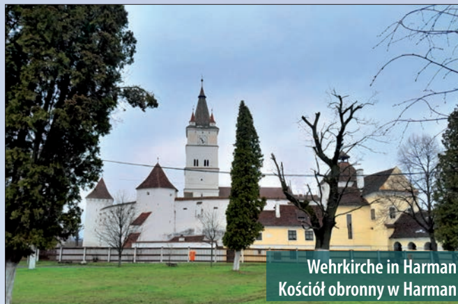
Wehrkirche in Harman Kościół obronny w Harman